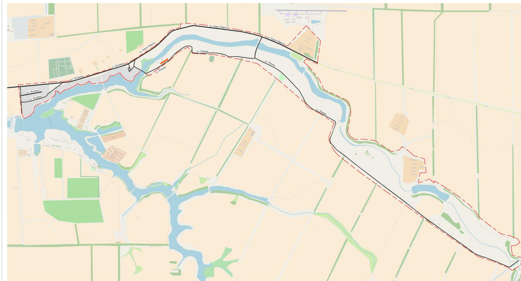
Рис. 4 - Существующие и перспективные парковки х. Карла Маркса