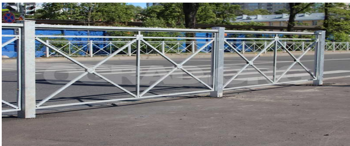
Рис. 5 - Пешеходное ограждение

Для предотвращения перехода пешеходом проезжей части в неустановленных местах используются ограничивающие пешеходные ограждения. Пример применения пешеходных ограждений показан на рисунке 5: