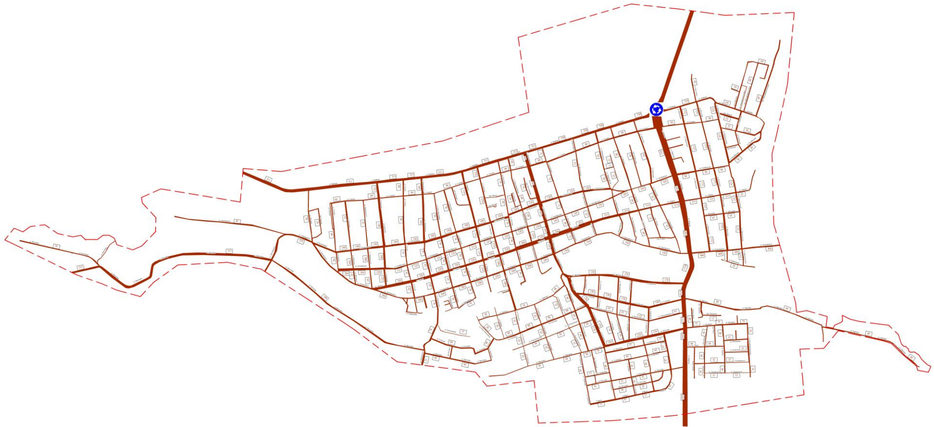
Рис. 1 - Картограмма расчетной часовой интенсивности движения, 2018 год